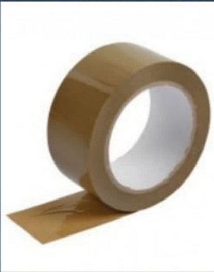
SCOTCH EMBALLAGE MARRON