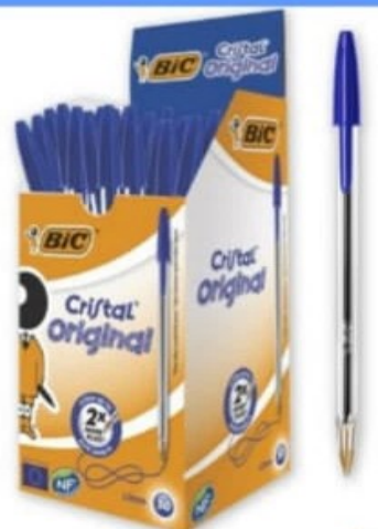
STYLO À BILLE