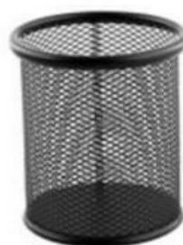
PORTE STYLO EN MÉTAL