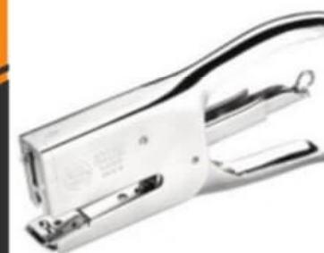
AGRAFEUSE A PINCE 24/6

MARQUE : EXPRESS DELTA KANGARO EUROPLIER PRIMULA