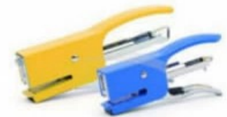
AGRAFEUSE A PINCE NUMÉRO 10