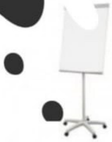
TABLEAU DE CONFÉRENCE