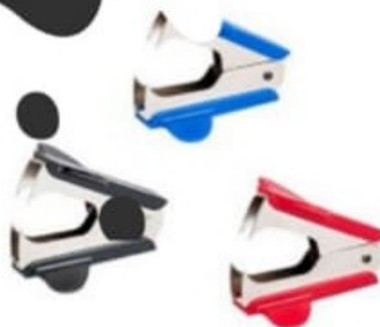
ARRACHE AGRAFE PLASTIQUE MÉTALLIQUE