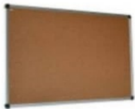
TABLEAU EN LIÈGE