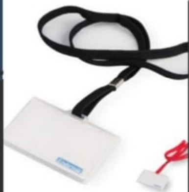
BADGE AVEC FIL