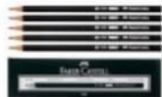
CRAYON À PAPIER