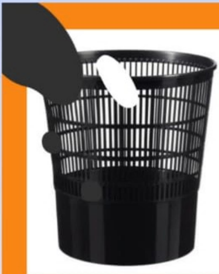
POUBELLE A PAPIER EN PLASTIQUE