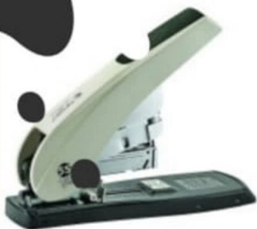
AGRAFEUSE GÉANT P.F