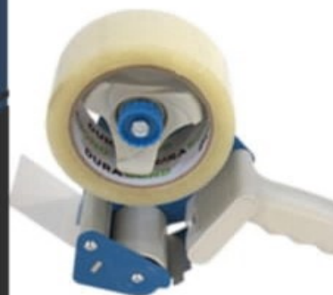
DÉVIDOIR SCOTCH EMBALLAGE