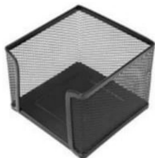
PORTE CUBE EN MÉTAL