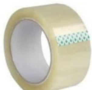
SCOTCH EMBALLAGE TRANSPARENT