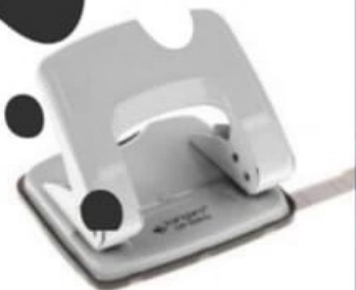
PERFOREUSE 2 TROUS