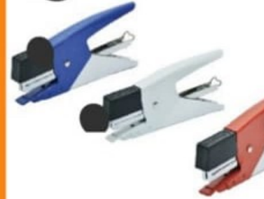
AGRAFEUSE A PINCE NUMÉRO 8/4